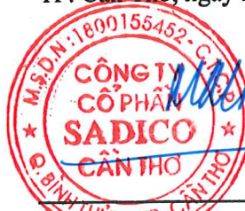
Mai Công Toàn Chủ tịch Hội đồng quản trị